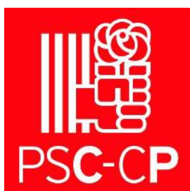
Luz Canovas Delgado Portaveu del PSC

Així mateix, anunciem que tampoc participarem en la lectura del manifest, el 26N, amb l'objectiu de mostrar la nostra disconformitat amb la decisió unilateral, per part del govern local, d'ajornament d'un dia tan rellevant.